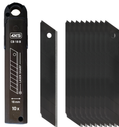
10 Ersatzklingen, Box